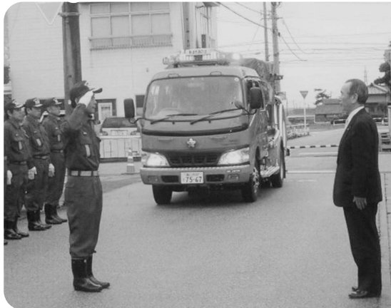
◀ハッスル消防第11分団一同

発行者 東城豊二 編集者 編集委員会 TEL 0765-22-2285 ホームページアドレス http://www.nice-tv.jp/~michi-k/