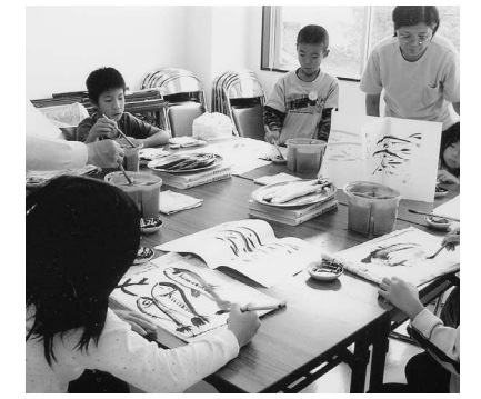
秋のサンマを描きました オイシソー! (創作サークル)