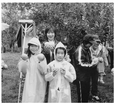
「王林」の収穫 おいしかったよ! (10月)